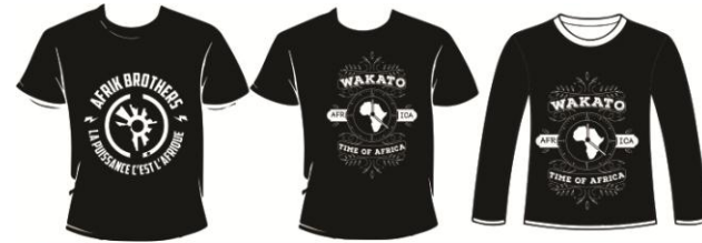
TEE-SHIRT - POLOS - DEBARDEUR - SWEAT