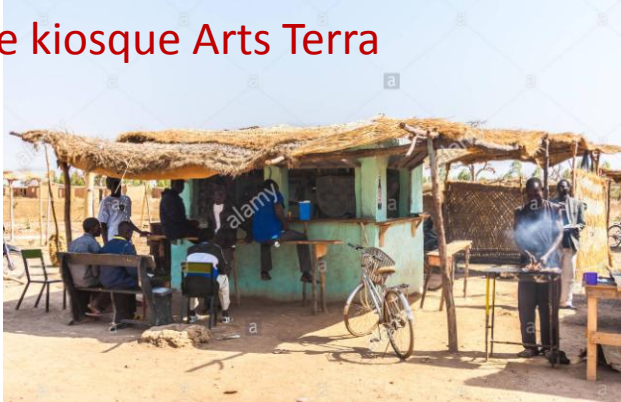
Le kiosque Arts Terra