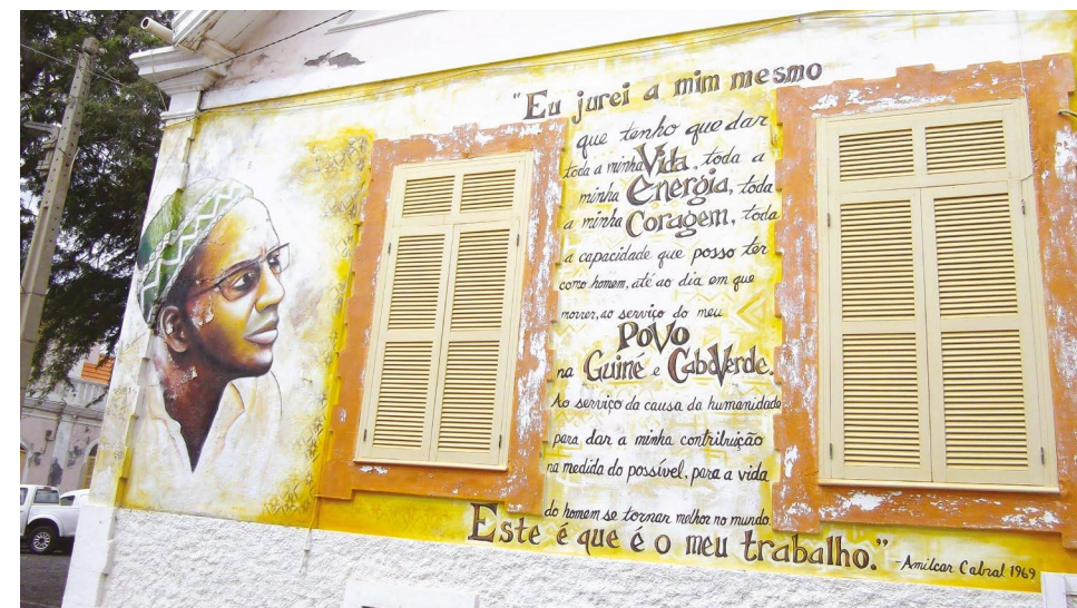
Peinture murale reprenant les mots d'Amílcar Cabral, fondateur du Parti Africain pour l'indépendance de la Guinée et du Cap Vert.

« conditions de possibilité » qui ont permis sa bonne mise en œuvre : un choix politique clair et constant depuis l'indépendance couplé à des priorités budgétaires affichées pour les dépenses sociales, le soutien des organismes internationaux, une petite taille de la population, qui permet un suivi fin de la population des bénéficiaires (moins de 20 000 personnes), leur connaissance presque directe par le réseau de travailleurs sociaux et une gestion facilitée de la montée en charge. Même si la configuration d'archipel peut rendre la gestion parfois complexe entre les îles, cette dernière peut s'appuyer sur un réseau d'infrastructures et de services sociaux existants et reste « à taille humaine ». Ces différentes spécificités contribuent à rendre effectif le projet d'universalisation de la couverture vieillesse au Cap-Vert.