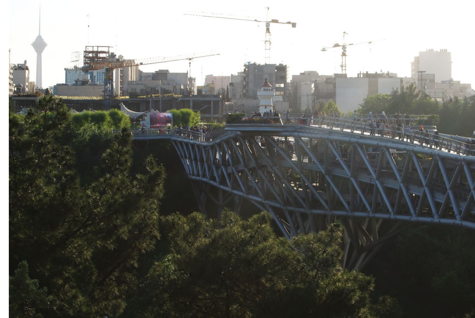
Pont piétonnier Tablath Bridge, Téhéran, Iran, 2016, Agnès et Denis Martouzet.

Cette situation risque de s'aggraver et de s'étendre dans un avenir proche en raison de la crise économique aiguë que la République islamique n'a, jusqu'alors, pas pu maîtriser et de l'absence de dispositifs nécessaires et surtout efficaces pour la prise en charge de toutes les personnes âgées, alors que leur nombre continue de croître rapidement.