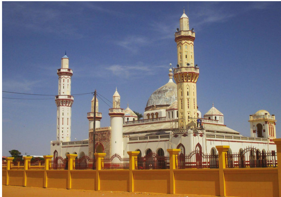
Mosquée de Diourbel, Sénégal, 2013. Muriel Sajoux

de Ouakam, nous faisons 40 % de social. Je ne peux pas passer de garde sans régler des cas. Des fois ils vous disent qu'ils n'ont pas d'argent. Je suis obligé de déboursier, d'aller négocier ou de me débrouiller. Je ne peux pas les laisser mourir ». Il apparaît à travers ces propos que l'aide gouvernementale aux personnes âgées reste très en deçà des besoins. Les prestataires de service dans les structures de santé se trouvent confrontés à des personnes âgées démunies qu'ils doivent traiter. De plus, en l'absence de professionnels pour accompagner les personnes âgées dans leurs parcours de soins, les familles sont obligées de s'impliquer comme en témoignent nos données d'observations.