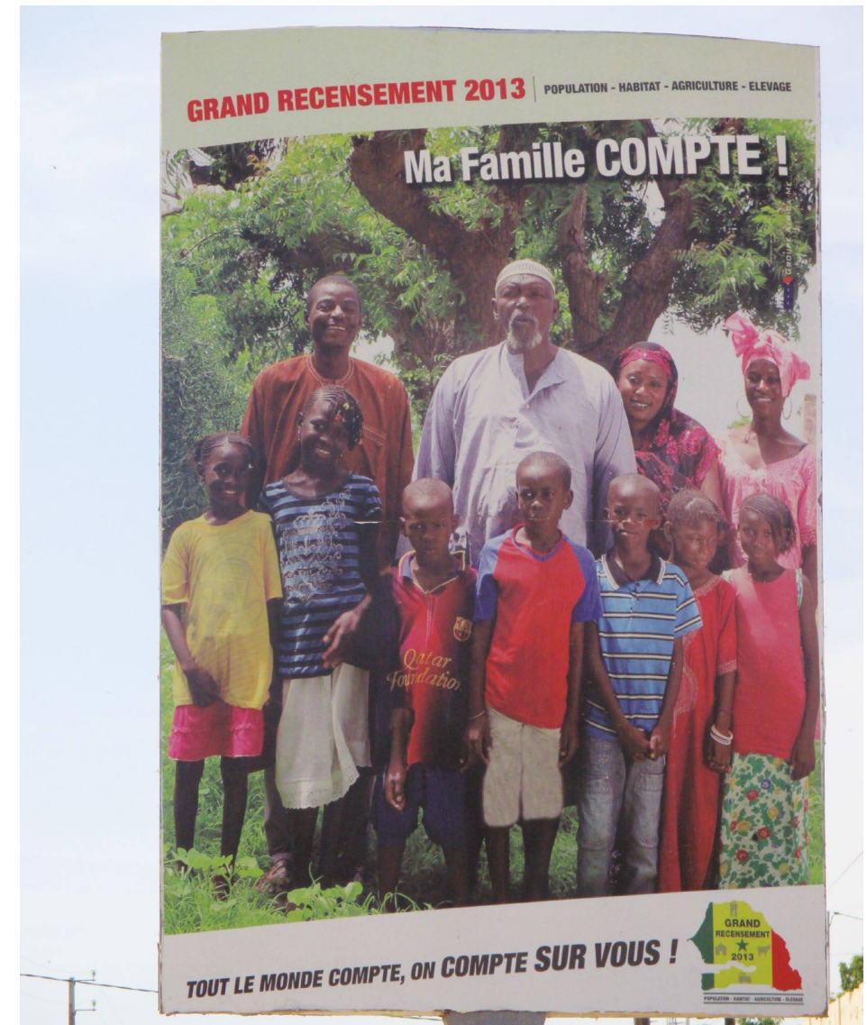
Diourbel, Sénégal, 2013. Muriel Sajoux

Comme cette dame, et contrairement aux idées reçues, certaines personnes âgées au Sénégal, vivent dans des situations de vulnérabilité et sont souvent seules, elles assistent impuissantes à la modification de leur statut et à la dépossesion de leur rôle social (Antoine, 2007). En effet, les migrations participent de plus en plus à la fragilisation du tissu social et à la solitude ou encore à l'isolement des personnes âgées. La proportion de personnes vivant seules est de 1,1 % pour les femmes âgées et de 1,4 % pour les hommes âgés (Antoine et Golaz, 2009). Ces chiffres s'expliquent par le veuvage mais aussi par les différentes formes de migration. De plus, il apparaît que la concentration dans la capitale des actions sanitaires et sociales dédiées aux personnes âgées rend problématique leur prise en charge dans les villes secondaires et en milieu rural très touché par les migrations internes et internationales.