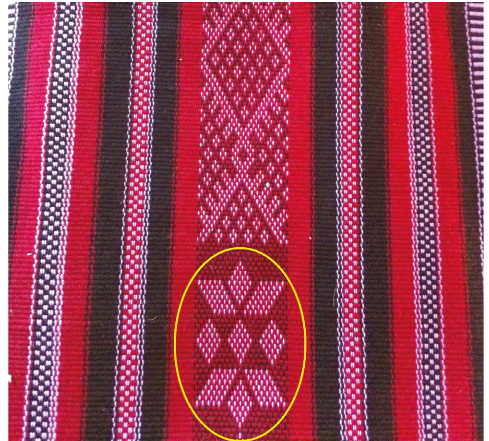
Photo 6. Motif approprié par la région de Béni Khédache

Le dernier élément de spécificité porte sur le choix des couleurs et des motifs, ainsi que leur rapport aux jebels Matmata. L'examen des tapis, des Margoum et des différents habits produits dans la région ne permet pas de les individualiser par rapport à ceux produits dans les régions limitrophes (Mareth, Ben Guerane, Djerba, Oudhraf, Gafsa...). Malgré l'appropriation par les femmes de Béni Khédache et de Toujane de certains motifs reproduits sur les tapis (Photo 6), plusieurs d'entre eux se retrouvent ailleurs. Les cas des figures du dromadaire, du jebel, de la main de fatma sont reproduits sur tous les tapis du pays et se retrouvent même en Algérie et au Maroc.