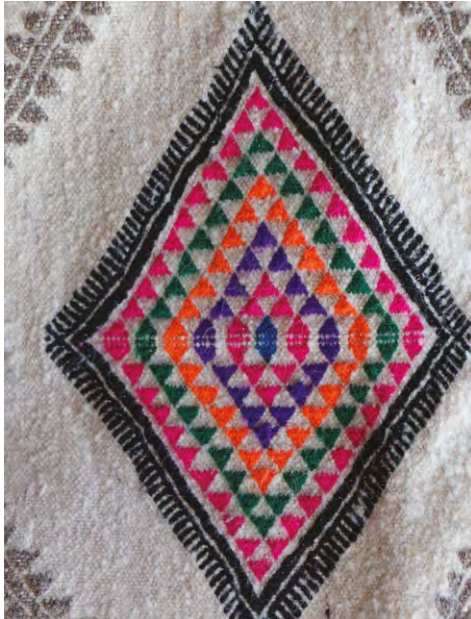
Photo 2 : Quelques motifs appliqués dans les tapis de Béni Khédache et Toujane et qui sont reconnus dans tout le Sud.

Les motifs dessinés sur ces tapis sont généralement ceux qu'on retrouve dans tout le Sud tunisien (la montagne, le dromadaire, la main de fatma, le poisson...)(photo 2). Seul le nombre de mailles est une spécificité du gouvernorat de Médenine (30x30). Ce nombre est tout de même imposé aux femmes par l'ONA. Leurs tapis ne seront certifiés que s'ils répondent, entre autres, à cette norme de qualité.