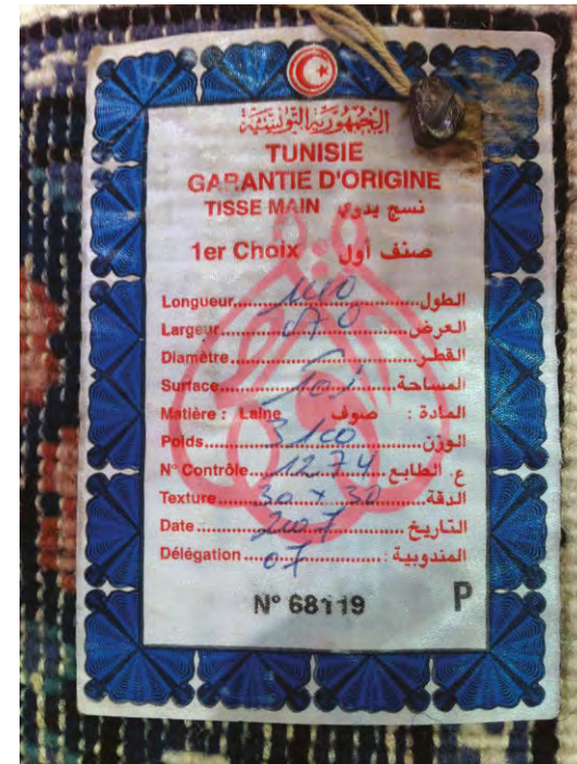
Photo 3. Certificat de garantie d'origine « Tissé main » collé aux tapis qui répondent aux normes et sur lequel on reconnaît le code 07 relatif à la délégation régionale de l'ONA de Médenine.

La certification s'effectue par les techniciens de l'ONA qui évaluent la conformité du produit par rapport aux normes mises en place par leur direction régionale. Ces normes consistent essentiellement en la finesse du tissage (nombre de mailles), le poids du tapis (la légèreté étant gage de qualité), la matière utilisée... Si le produit répond à ces normes il sera certifié « Garantie d'origine – Tissé main ». Un cachet est alors attaché au tapis indiquant notamment les dimensions du produit, l'année de sa production, le nombre des mailles, son poids et son origine géographique (Photo 3).