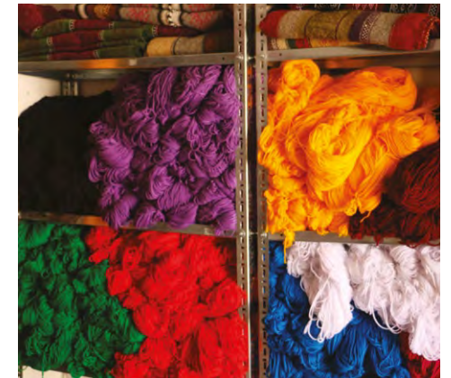
Photo 5. Stock de laine industrialisée achetée de l'usine de Ksar Hellal dans le Sahel tunisien

qualité, des difficultés de leur transformation et de la concurrence qu'elles subissent. Celle-ci est le fait d'une matière première industrialisée plus facile à acquérir à des prix très compétitifs (Photo 5).