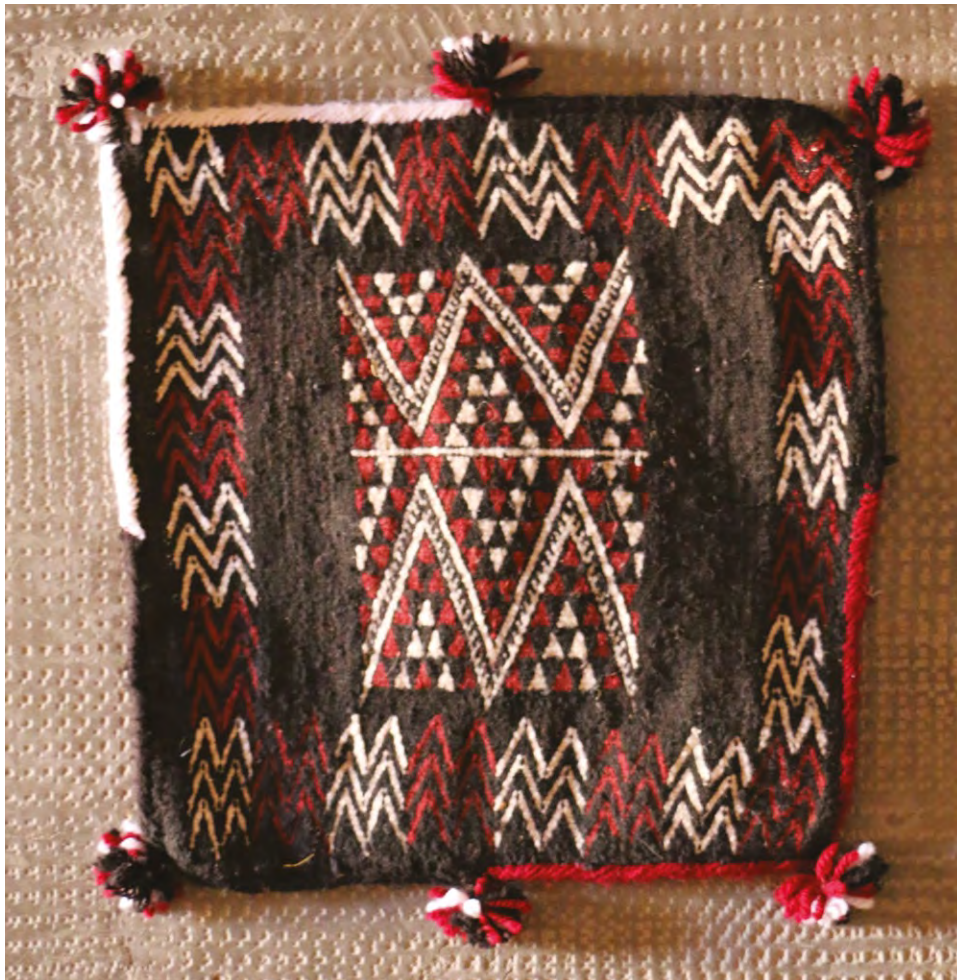
Photo 4. Maquette traditionnelle créée par les femmes de Béni Khédache

dans la tête avec des dessins classiques qui représentent souvent leur région, soit elles appliquent les modèles et les couleurs demandées par leurs clients.