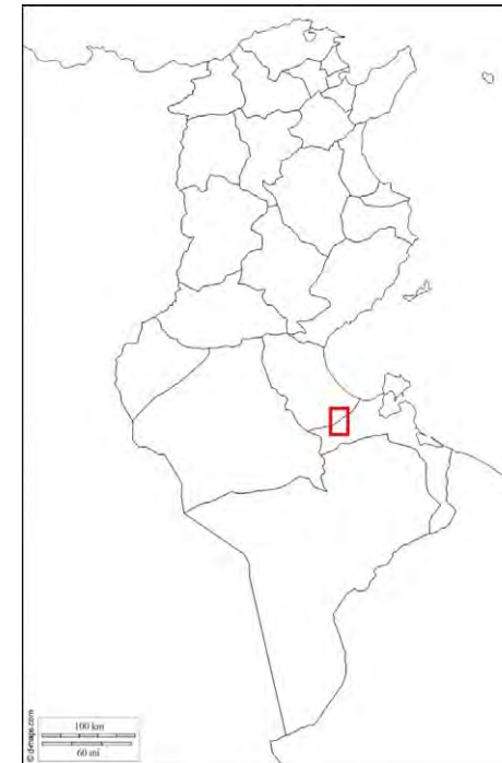
Fig. 1 : Localisation de la zone d'étude

gouvernorat de Gabès. Dans sa partie sud, la zone d'étude fait partie de la délégation de Béni Khédache appartenant au gouvernorat de Médenine (Figure 1).