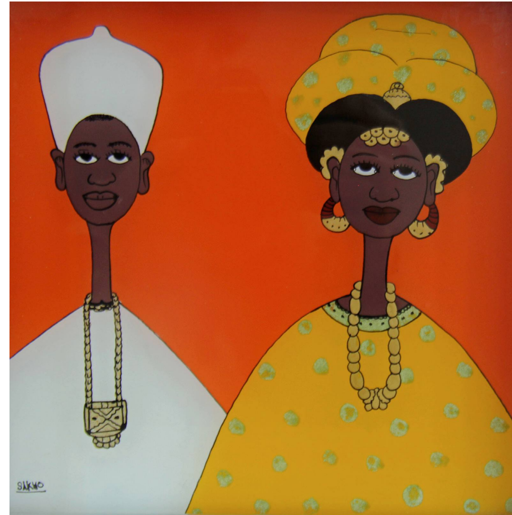
Peinture sous-verre ou «fixé», Sénégal, Sakko.

L'après divorce des femmes reste tributaire de leur âge au divorce, leur niveau d'instruction, le statut d'occupation de l'ex mari, les réseaux familiaux auxquels elles appartiennent. Somme toute, la réorganisation de la vie affective, économique et sociale des femmes divorcées nous fait dire que le divorce offre aux femmes le privilège qui est réservé aux hommes grâce à la polygamie.